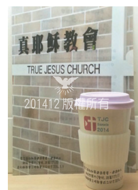
成立教會紀念資料夾與陶瓷杯

目 前安息日聚會人數約60人，每週二、五晚間聚會，另有週三的臺北大學校園團契與家庭聚會、週四詩班團契、週六的宗教教育及各團契聚會。職務會亦有共識於六年內另尋更大的會堂空間，在穩定中持續追求成長，也企盼更多住在三峽地區的弟兄姊妹能落地生根，就近參與聚會及協助聖工，壯大神的家，同得主恩、拓展福音，在三峽地區高舉耶穌基督的名。