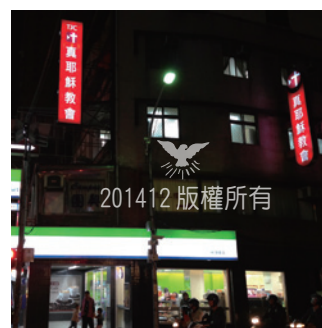
2014. 1. 1三峽成立教會特聚