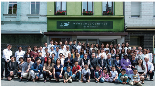
Wahre Jesus Gemeinde im Rheinland Einweihung 萊茵教會獻堂禮