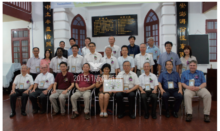
▲與湖南基督教兩會座談

來到會堂門口旁的「耶穌巷」，寶貴回憶歷歷在前，如潮湧入我心田，思緒迴旋，過往見證在眼前。會堂正門口兩側寫著「行所當行真理」與「信以致信福音」。會堂內的牆壁上刻著「真耶穌教會」，並有美麗的葡萄點綴在兩旁，會堂內上下樓講台各刻有「哈利路亞」字樣，兩側壁上刻著「入聖殿頌真神救恩遍臨萬代」、「進恩門贊基督真光普照萬民」，講台後刻有「十誡」與「祈禱文」，另一層刻著「活水出錫安澎湃分流東西海」、「靈恩先中土豐盈普照億兆民」。該會堂建築為近現代保護建築，不可移動文物，可見這一切美好的記憶，成為歷史的見證，當我們徘徊在眼前，期盼我們的信仰根基更堅定，並能傳承這美好的信仰給下一代。