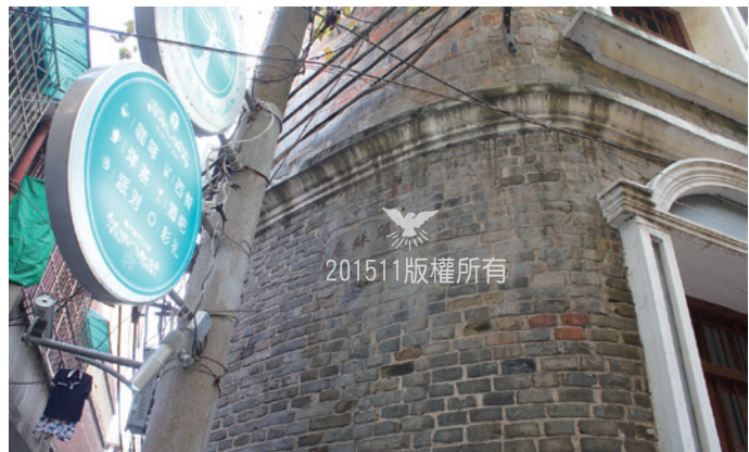
▲湖南長沙潮宗街教堂與教堂旁的耶穌巷