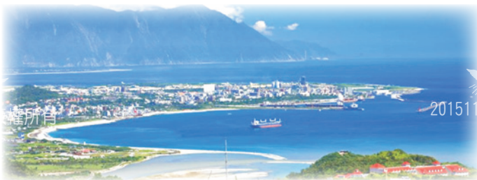
宛若仙境的花蓮港