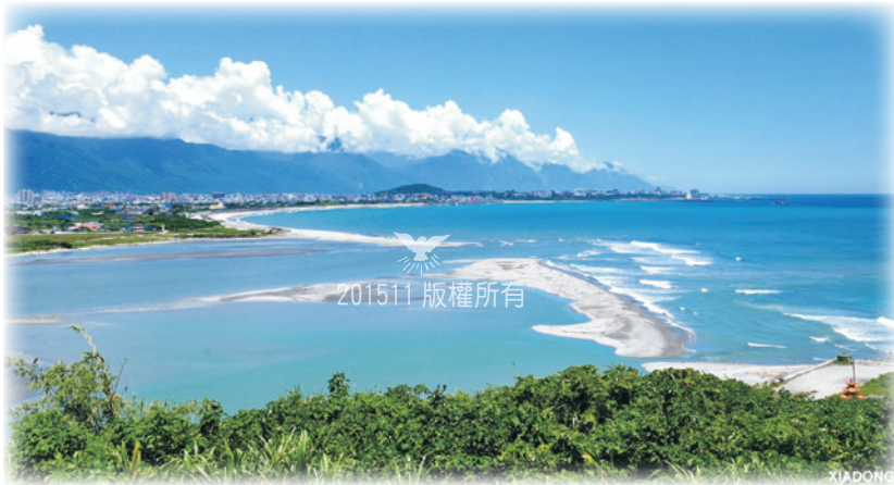
千川注江海，洄瀾 1 恆激盪

在自然山脈襯托下，花蓮海灣海浪起伏的連綿翻捲，散發大自然的舞動，氣象萬千，故取「洄瀾」諧音「花蓮」名至實歸！