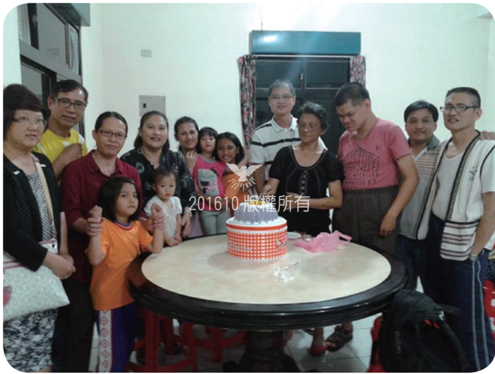
公公當時在台灣，不但費心為婆婆慶生，更在婆婆最後時日，全心全意照顧、關懷婆婆，令婆婆深深感動，實在是我們後輩的榜樣！

感謝主，我們有祿，有這份福氣在主愛中同享這份平安，相信神會為我們預備住處的安然。