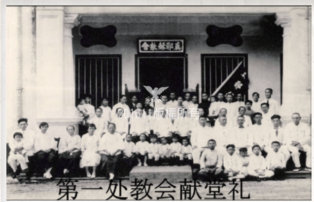
▲Kinta Road TJC 1927（近打路11號）