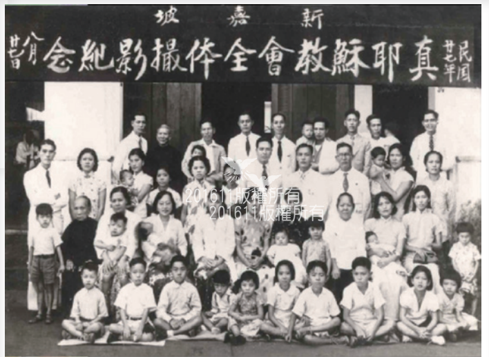
▲Beach Road TJC

西馬來西亞新加坡總會： 1976年5月30日，「泛馬來亞諮詢委員會」正式歸入西馬來西亞新加坡總會。