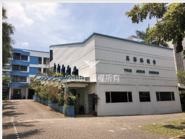
▲Adam Road Church 亞當路教會

新加坡聯絡處：24年後，即2000年新加坡教會成立了聯絡處（SCB）。聯絡處讓新加坡教會能夠針對當地會眾的需求進行靈性的培養。