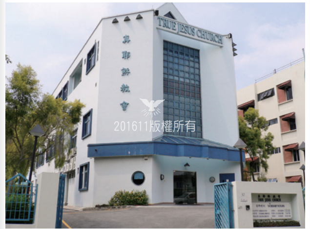
▼Telok Kurau Church (Present) 直落古樓教會現況