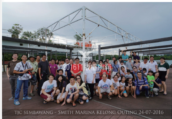
TJC SEMBAWANG - SMITH MARINA KELONG OUTING 24-07-2016

印度：1969年，兩名聖工人員分別從新加坡和馬來西亞前往馬德拉斯Madras（現為真奈Chennai）。他們向一些巡迴傳教士宣講真理。靠著神的恩典，幾位傳教士和他們的家人接受了真理並接受了洗禮。這是聖工在印度的開始。