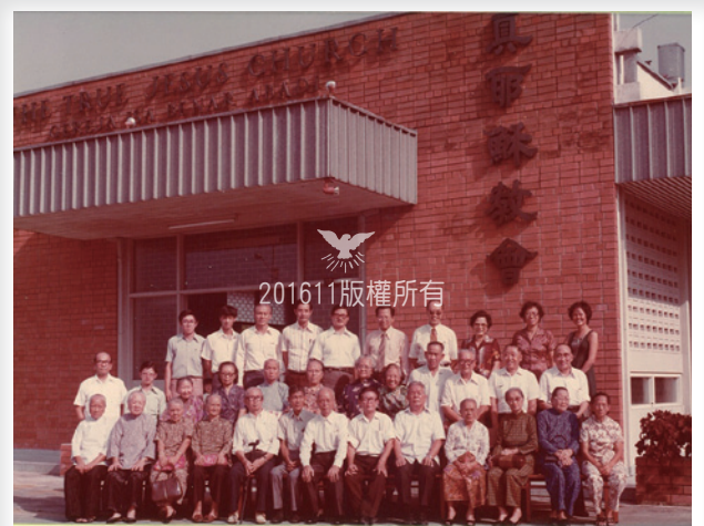
▲Telok Kurau Church