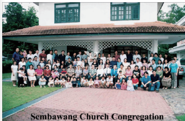
Sembawang Church Congregation

新加坡在東南亞具有戰略性的地理優勢。多年來新加坡教會有許多的機會協助在該區域的宣道工作。