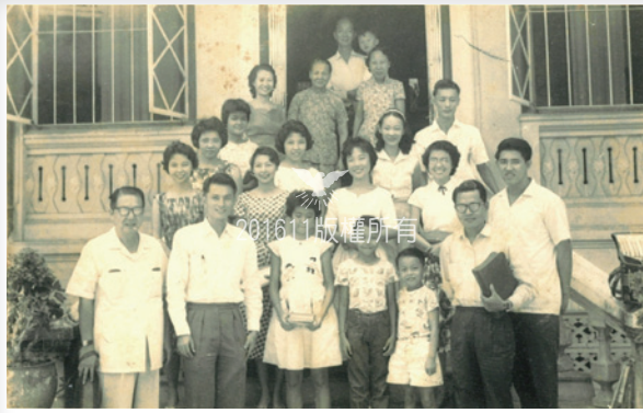
▲Home Bible Study (1950s) 家庭聚會

實龍崗上段聚會點： 幾年來，住在新加坡東北部的信徒，租用「基督女少年軍活動中心」作星期五晚上的崇拜聚會。這個聚會點是「新加坡聯絡處」為栽種教會而成立的。在神奇妙的安排之下，新加坡聯絡處預計今年（2016）內在東北部成立第四個聚會點。成立初期將由直落古樓教會管理和牧養，之後由新加坡聯絡處正式註冊為教會。住在附近的信徒大約有160名，多數信徒現屬直落古樓教會，小部分屬亞當路教會。